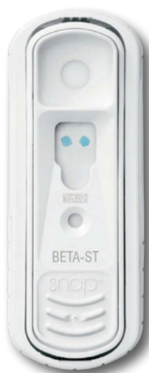
SNAP Beta-Lactam ST

Testy IDEXX SNAP ST są jedynymi na rynku szybkimi testami do wykrywania pozostałości antybiotyków w mleku, które nie wymagają inkubacji. Dzięki zmniejszeniu ilości etapów badania pozwalają uzyskać wynik szybciej i przy mniejszym nakładzie pracy.