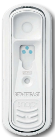
SNAPduo Beta-Tetra ST

Dodaj próbkę mleka do próbki z odczynnikiem